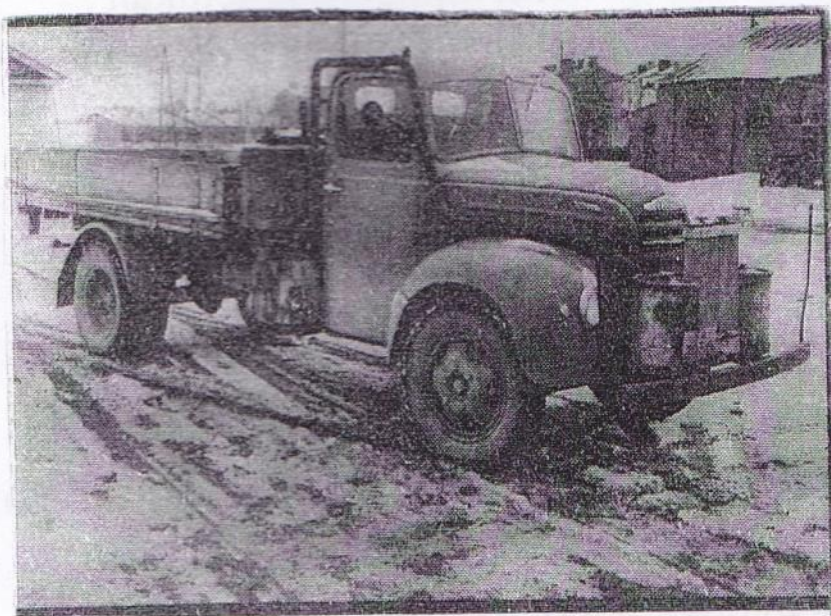
Loppuunajettu Ford Thames puu- kaasutinauto. Vanhaa sota-ajan taitoa ei päästetä varuskunnissa unohtumaan.