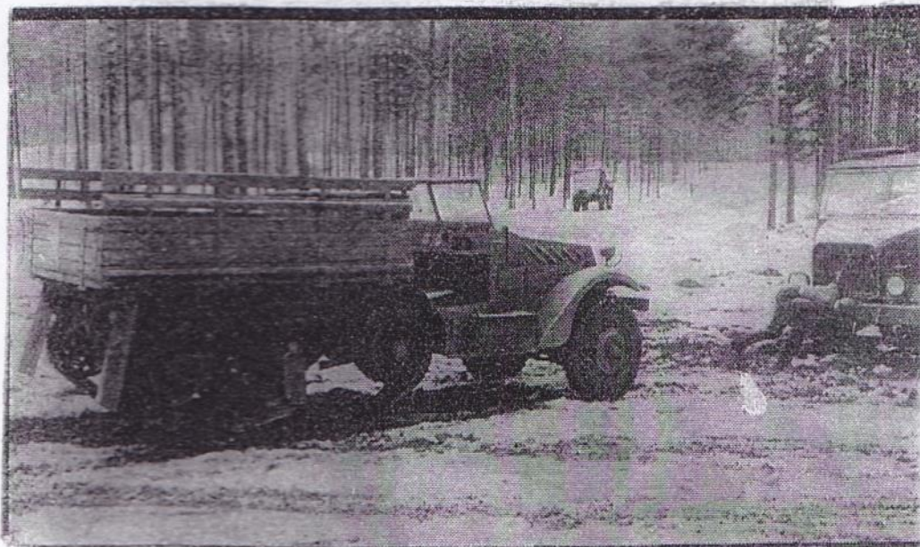
White-tela-auto. Keskimääräinen ajo- kilometrihinta ilman pääoma- kustannuksia 100,3 markkaa.